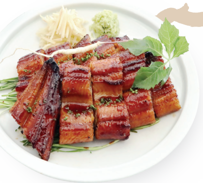
진(眞) 장어구이 반상 75,000원