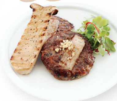
마떡갈비 구이 반상 56,000원