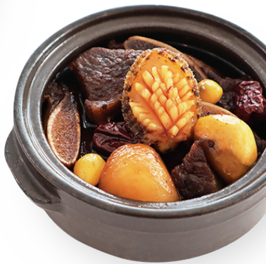
전복 갈비찜 반상 69,000원