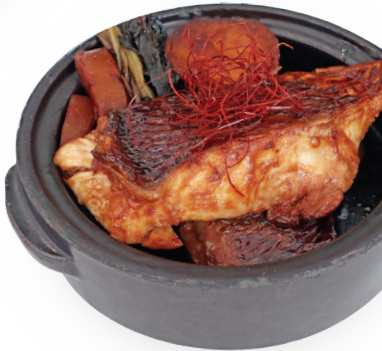
참도미 조림 반상 59,000원