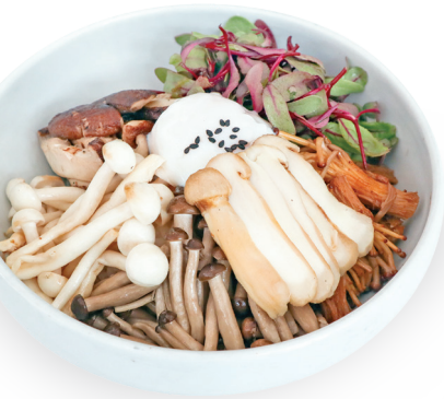
송이버섯 골동반 반상 57,000원

산과 바다에서 나는 온갖 귀한 것들로 정성스럽게 차려 낸 사대부 家 절기 반상