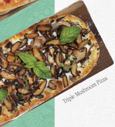
Triple Mushroom Pizza