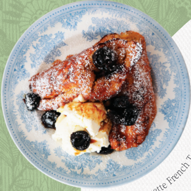
Baguette French Toast