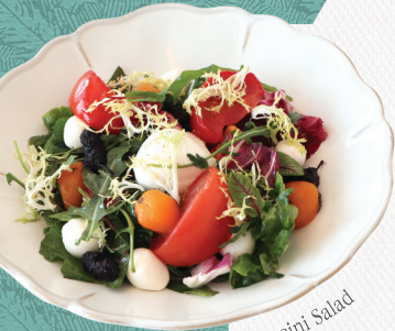
Burrata Bocconcini Salad