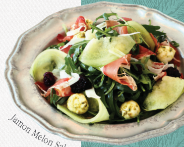
Jamon Melon Salad

바삭하게 튀긴 아보카도에 토마토, 아스파라거스와 참깨 드레싱을 곁들인 샐러드 Deep-fried Avocado, Tomato, Asparagus, Grana Padano, Sesame Dressing