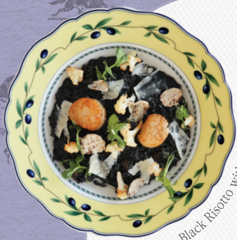
Truffle Black Risotto with Scallop