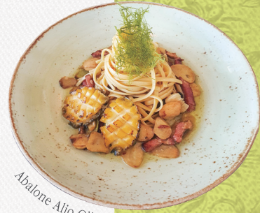
Abalone Alio Olio