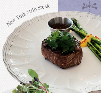
New York Strip Steak

부드러운 안심 스테이크와 그릴링한 아스파라거스, 매시 포테이토를 곁들인 그릴 메뉴 Tenderloin Steak, Asparagus, Mashed Potato, Baby Greens