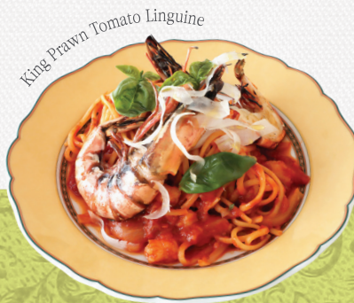
King Prawn Tomato Linguine