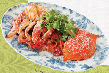
Crab Rose Linguine Piccole

꽃게와 직접 만든 비스크 소스 베이스의 로제 크림 링귀니 피콜레 Crab, Cherry Tomato, Grana Padano, Bisque Rose Sauce, Linguine Piccole