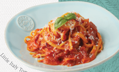
Little Italy Tomato Linguine

리틀 이태리 토마토 링귀니 Little Italy Tomato Linguine 매콤한 토마토소스와 베이컨이 어우러진 링귀니