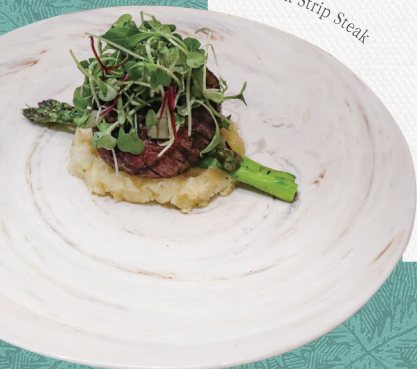
New York Strip Steak

안심스테이크 (150g/ 미국산) Tenderloin Steak +10,0 부드러운 안심 스테이크와 그릴링한 아스파라거스, 매시 포테이토