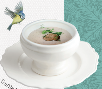
Truffle Mushroom Soup

트러플 머쉬룸 스프 Truffle Mushroom Soup 트러플 향을 살린 부드러운 버섯 스프