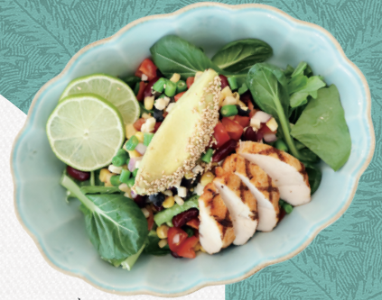
Mexican Cobb Salad