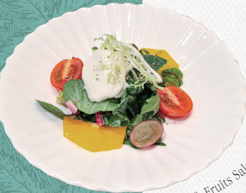
Burrata & Fruits Salad

부라타 과일 샐러드 Burrata&Fruits Salad 상큼한 과일을 곁들인 부라타 치즈 샐러드