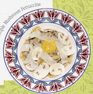
Triple Mushroom Fettuccine