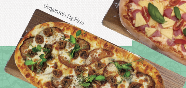
Gorgonzola Fig Pizza