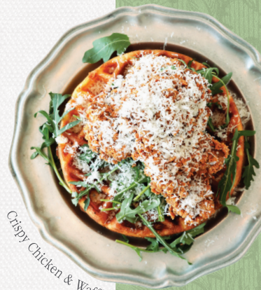
Crispy Chicken & Waffle

통통한 새우와 아보카도, 브로콜리, 수제 과카몰리를 얹어 낸 오픈 샌드위치 Avocado, Shrimp, Broccoli, Guacamole, Toasted Campagne