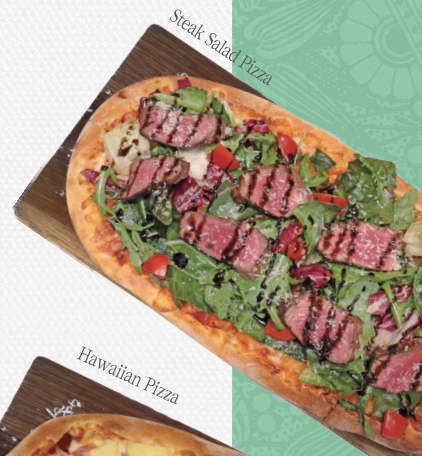
Steak Salad Pizza