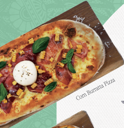
Corn Burrata Pizza