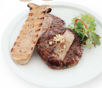
마떡갈비 구이 반상 54,000원