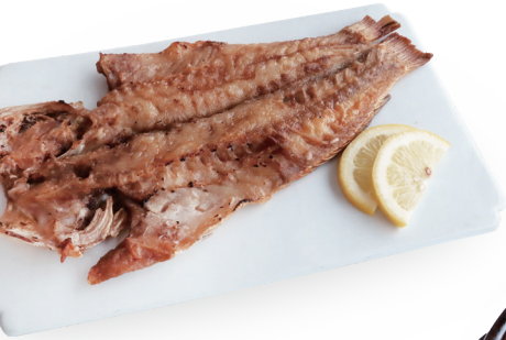
제주 옥돔구이 반상 59,000원

산과 바다에서 나는 온갖 귀한 것들로 정성스럽게 차려 낸 사대부 家 절기 반상