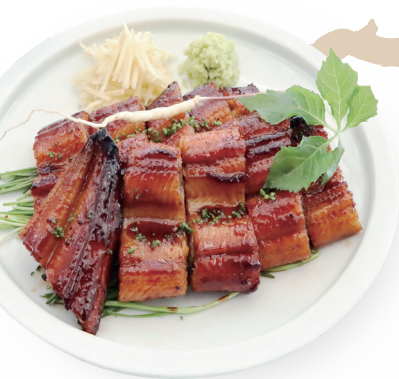
진(眞) 장어구이 반상 70,000원