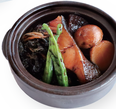
은대구 조림 반상 57,000원