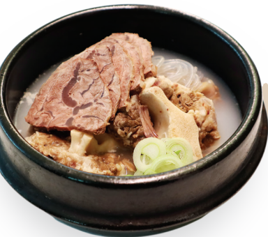
우미(牛尾) 곰탕 반상 55,000원