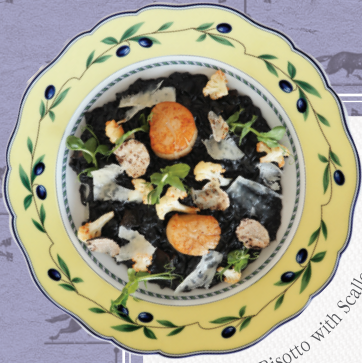
Truffle Black Risotto with Scallop