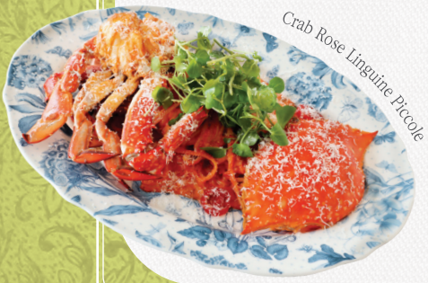
Crab Rose Linguine Piccole