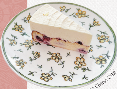
Blueberry Cheese Cake