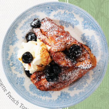
Baguette French Toast

🇫🇷 바게트 프렌치 토스트 Baguette French Toast ..... 26,0