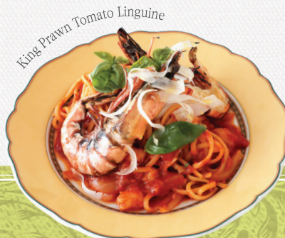
King Prawn Tomato Linguine