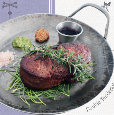
Double Tenderloin Steak

두 배로 즐기는 안심 스테이크와 네 가지 스타일의 소스 (홀그레인머스타드/ 샬사베르데/ 히말라야핑크솔트/ 레드와인소스) Tenderloin Steak, Whole Grain Mustard, Salsa Verde, Himalayan Pink Salt, Red Wine Sauce