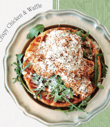
Crispy Chicken & Waffle

계란과 초리조, 모짜렐라, 가지를 넣어 끓인 이스라엘식 스파이시 토마토 스투 Spicy Tomato Stew, Chorizo, Eggs, Mozzarella, Eggplant, Basil, Bread