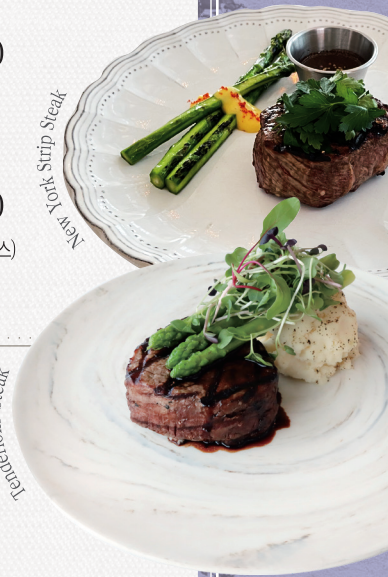
New York Strip Steak