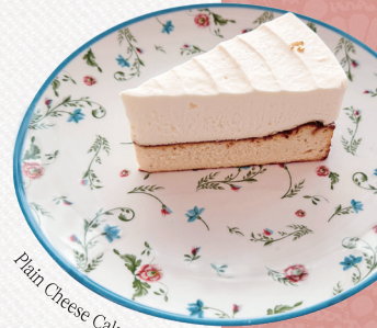
Plain Cheese Cake