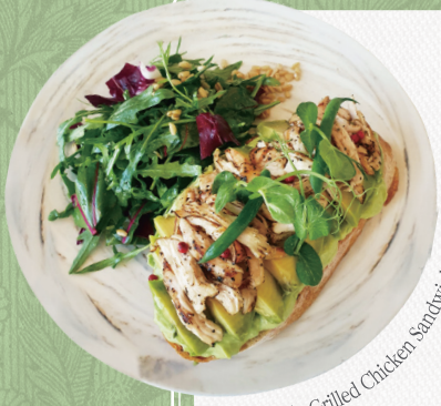
Avocado Grilled Chicken Sandwich