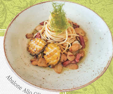
Abalone Alio Olio