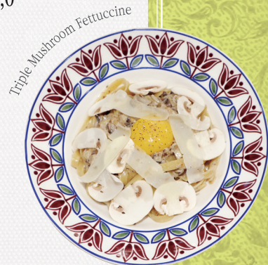
Triple Mushroom Fettuccine